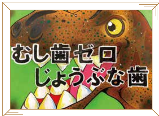
小学校 高学年の部