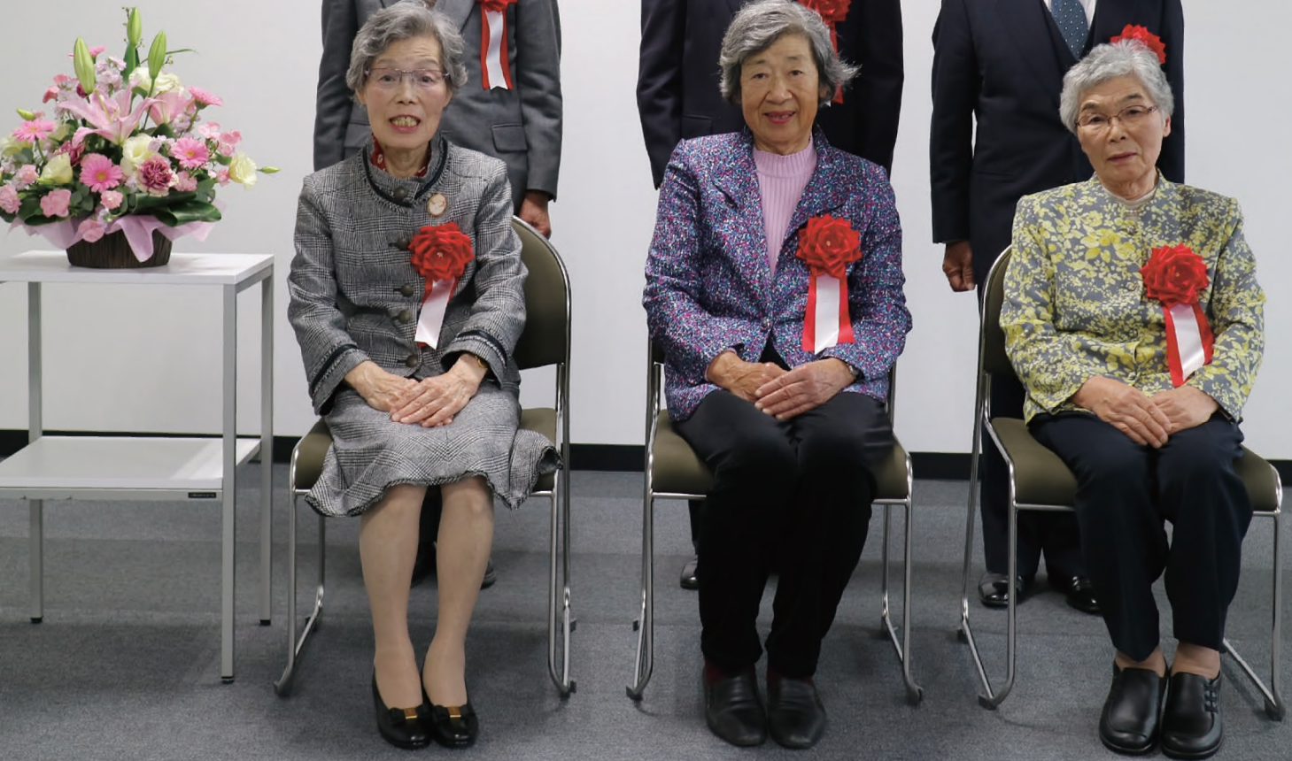
平成29年度受賞者の皆さん